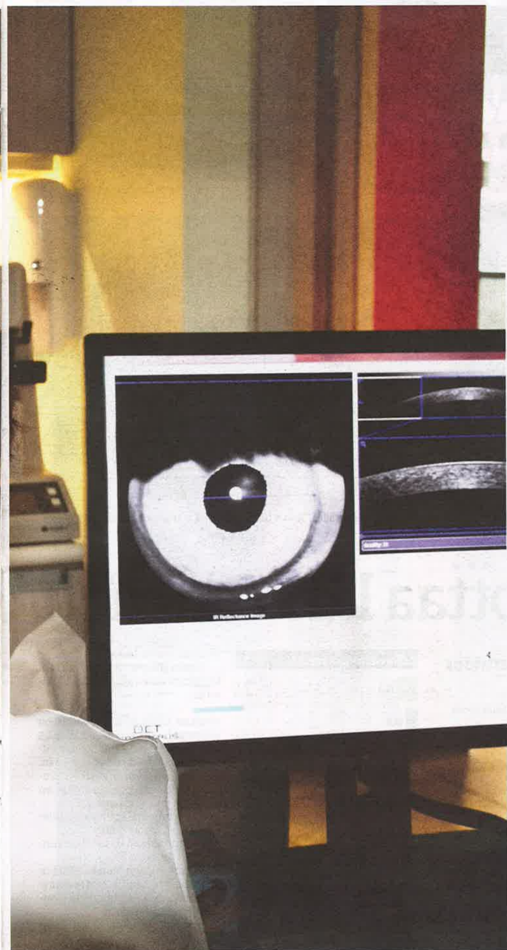
ja käyneet terveystarkastuksissa, mutta paikalliset sairaalat ja klinikat arvioivat palveluiden