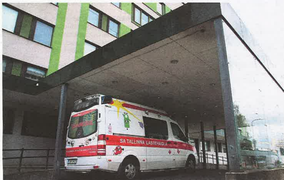
PAIKALLISTA. Mahdolliset potilasvahingot korvataan kunkin maan lakien mukaisesti.