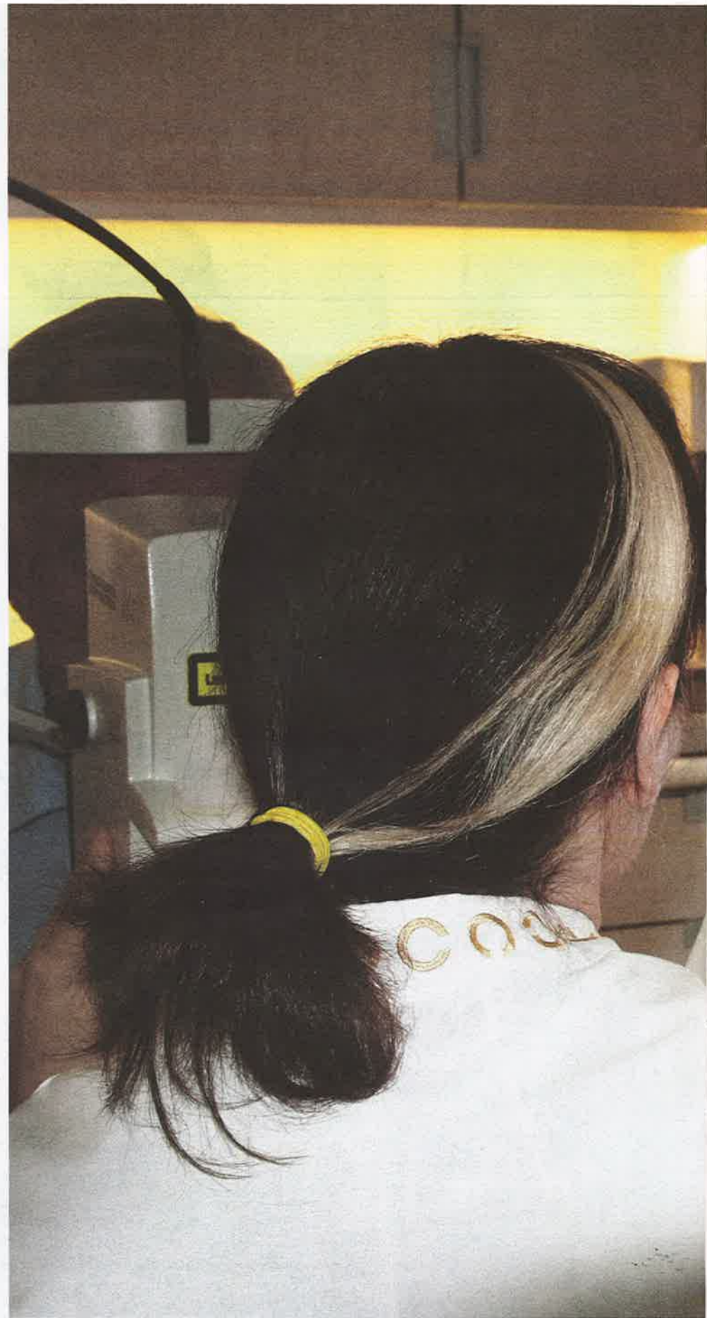
KASVUSSA. Toistaiseksi suomalaiset ovat hoidattaneet Virossa pääasiassa silmiään, hampaitaan laajentuvan yhä useammin esimerkiksi syöpä- ja sydänhoitoihin sekä lonkka- ja polvileikkauksiin.