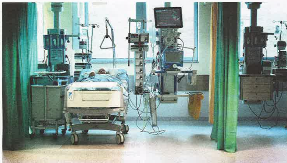
OMAA PIIKKIIN. Virossa voi joutua maksamaan itse lakanoista, sairaalavaatteista, ruuasta, juomista ja huoneen televisiosta. Näistä lisäpalveluista Kela ei maksa korvauksia.